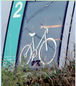
embarquent les vélos ...