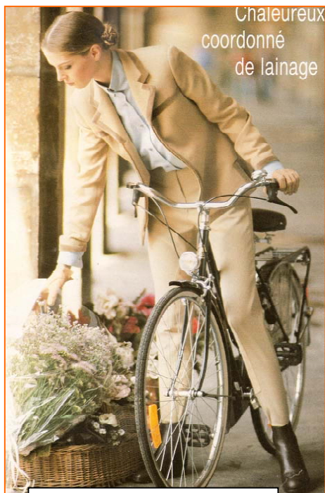
Figaro-madame, 12 sept 1992