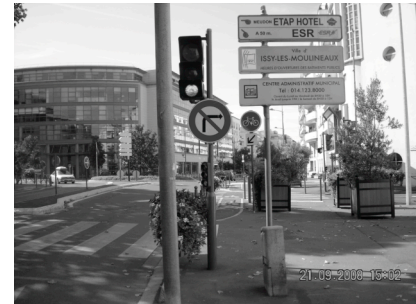
Quel service est rendu au cycliste ?

→ Des aménagements pour cyclistes ? Seulement là où ils rendent service !