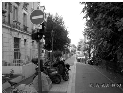
Un simple arrêté...