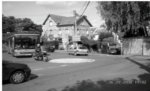
Les solutions légères sont souvent efficaces