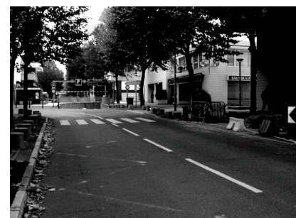
Une difficulté impossible à résoudre...

→ Tenir compte de tous les modes, penser à tous les usagers