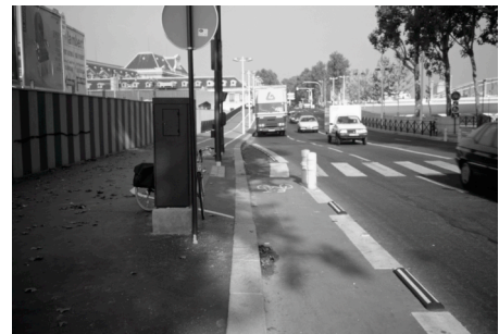
Ne pas imposer d'arrêt inutile

→ Les seuils, comme les arrêts, sont la hantise des cyclistes