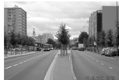
Il n'y a plus aucune place pour le vélo !

→ Relier le quartier à ses voisins et à la ville