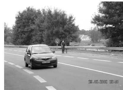
A-t-on vraiment pensé aux usagers concernés ?