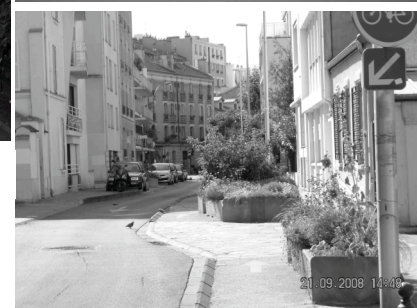
Contradictions dans les termes, aménagements spectaculaires...

→ Les solutions légères sont souvent efficaces